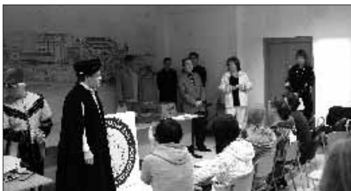
Zahájení Historiády v zasedací místnosti školy

Historiáda je ukázkou tvůrčího přístupu ke zkoumání dějin. Žáci a žákyně nesypou z rukávu suchá fakta, ale stávají se aktivními badateli, propojují teorii s praxí, přenášejí dějepisné poznatky do terénu, řešení úkolů vyžaduje jejich schopnost kombinace a rychlého úsudku, leckdy i manuální zručnosti.