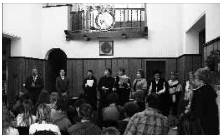
Slavnostní předání cen vítězům Historiády v Baťově vile ve Zlíně