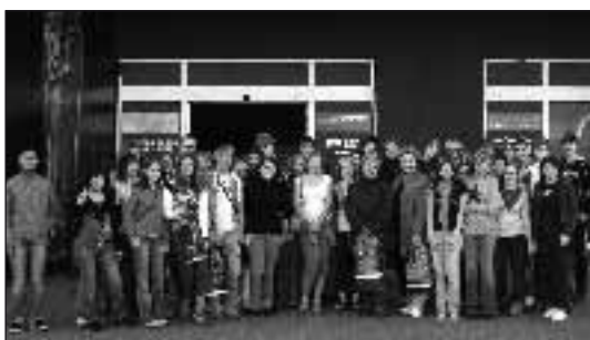
V listopadu 2008 si žáci převážně 1. ročníku a kvint prohlédli jedinečnou výstavu Tutanchamon v Brně v Titanic Hall