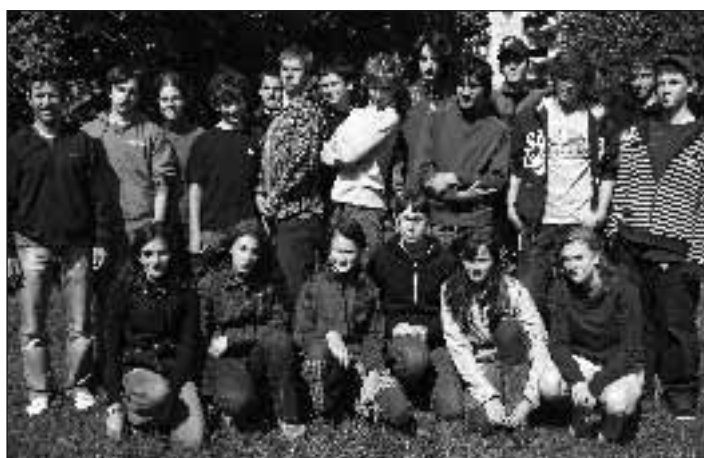
V červnu 2009 se v Olomouci uskutečnil přebor škol v orientačním běhu – Celostátní finále 2009 a závod Gigasport Tour 2009, kterého se zúčastnilo i družstvo naší školy