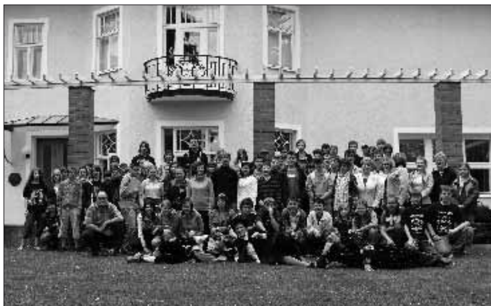
Účastníci soutěže Historiáda

Celá akce byla všemi účastníky hodnocena jako velmi zdařilá a úspěšná.