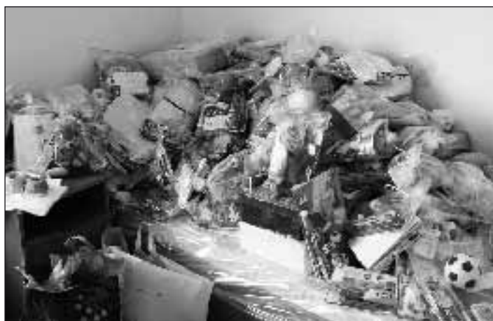
V rámci humanitního projektu Kids to Kids poslali žákyně a žáci naší školy více než 200 balíčků do Nikaraguy

Účetní výkazy jsou součástí účetní závěrky sestavené k rozvahovému dni 31. 12. 2008.