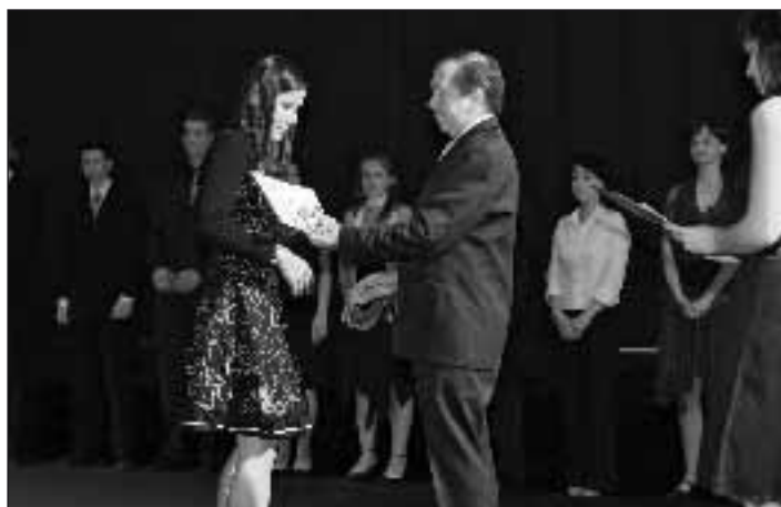
Slavnostní předávání maturitních vysvědčení ředitelem školy