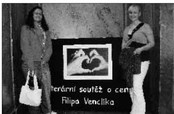
V dubnu 2009 zavítaly žákyně naší školy na slavnostní vyhlášení Literární soutěže o cenu Filipa Venclíka