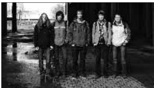
V březnu 2009 se 5 žáků maturitního ročníku naší školy zúčastnilo studentské konference na Gymnáziu Olgy Havlové v Ostravě, která se týkala období normalizace v Československu