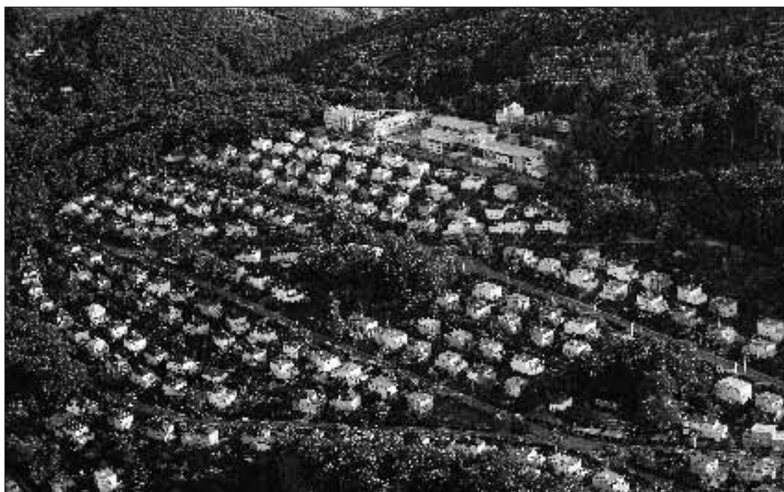
Letecký snímek areálu školy ve Zlíně – Lesní čtvrti

Celkové finanční náklady na další vzdělávání nepedagogických pracovníků za rok 2008 jsou ve výši 7 804 Kč .