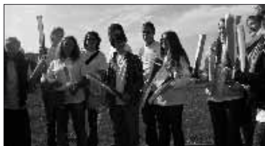
Žáci 2. ročníku a sexty B se zúčastnili výměnného pobytu v Limbachu-Oberfrohna v Německé spolkové republice, kam jsou pravidelně každý druhý rok zvááni naší partnerskou školou