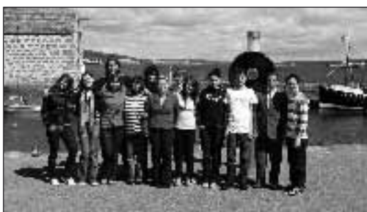
V červnu se skupina 11 žáků naší školy zúčastnila konference projektu Global Classroom na Shetlandských ostrovech