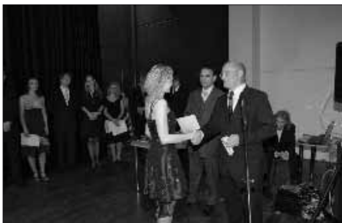
Předávání Německého jazykového diplomu německým lektorem