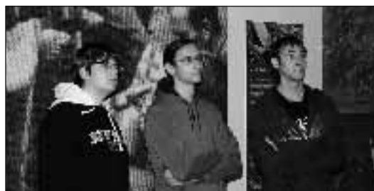
V lednu 2009 zorganizovali vyučující dějepisu exkurzi do Prahy na výstavu Republika a Svatý Václav